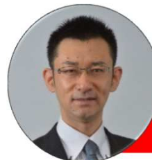
実行委員長あいさつ

秋の気配も次第に濃くなり、好季節となりましたが皆様いかがお過ごしでしょうか？ 今回の第51回静岡大会に向けて練習を積み重ねてこられた皆様においては悔いのないようプレーし、「富士に挑む！跳ぶ！駆ける！心と体！」で壮大な富士山のふもとで大会を盛り上げていただくことを期待しています。来年は彩の国・埼玉で「彩の国で魅せよう多彩なプレー！深めよう絆を！」をテーマに第52回全国ろうあ者体育大会を開催いたします。埼玉は歴史・祭・食・水など多彩な観光地です。私たち実行委員会は、来年にたくさんの選手と皆さんが埼玉で魅力のある多彩なプレー、そして選手や関係者たちと絆を深められるよう、準備をしています。ぜひ埼玉でお会いしましょう！