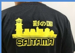
Tシャツ (黒・ピンク) 2,000円

多彩なグッズ販売中！ (売上は「第52回全国ろうあ者体育大会」の運営に充てられます)