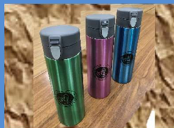
真空ステンレスボトル 各 1,500円