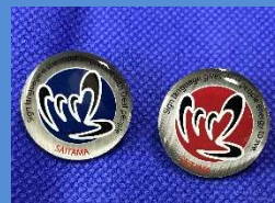
ピンバッジ (青・赤) 各 500円