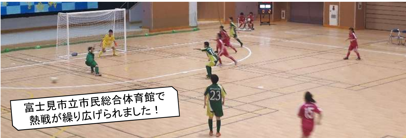
富士見市立市民総合体育館で 熱戦が繰り広げられました！