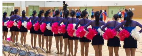
西武台高等学校による パフォーマンスショー