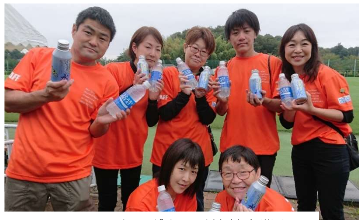
要員Tシャツ、水、ポカリは協賛企業よりご提供いただきました。