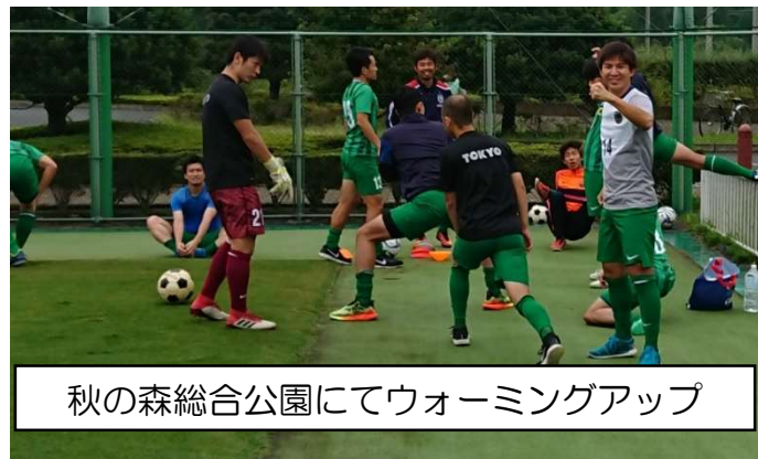
秋の森総合公園にてウォーミングアップ